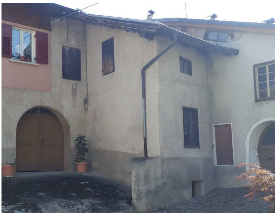
Vista da nord