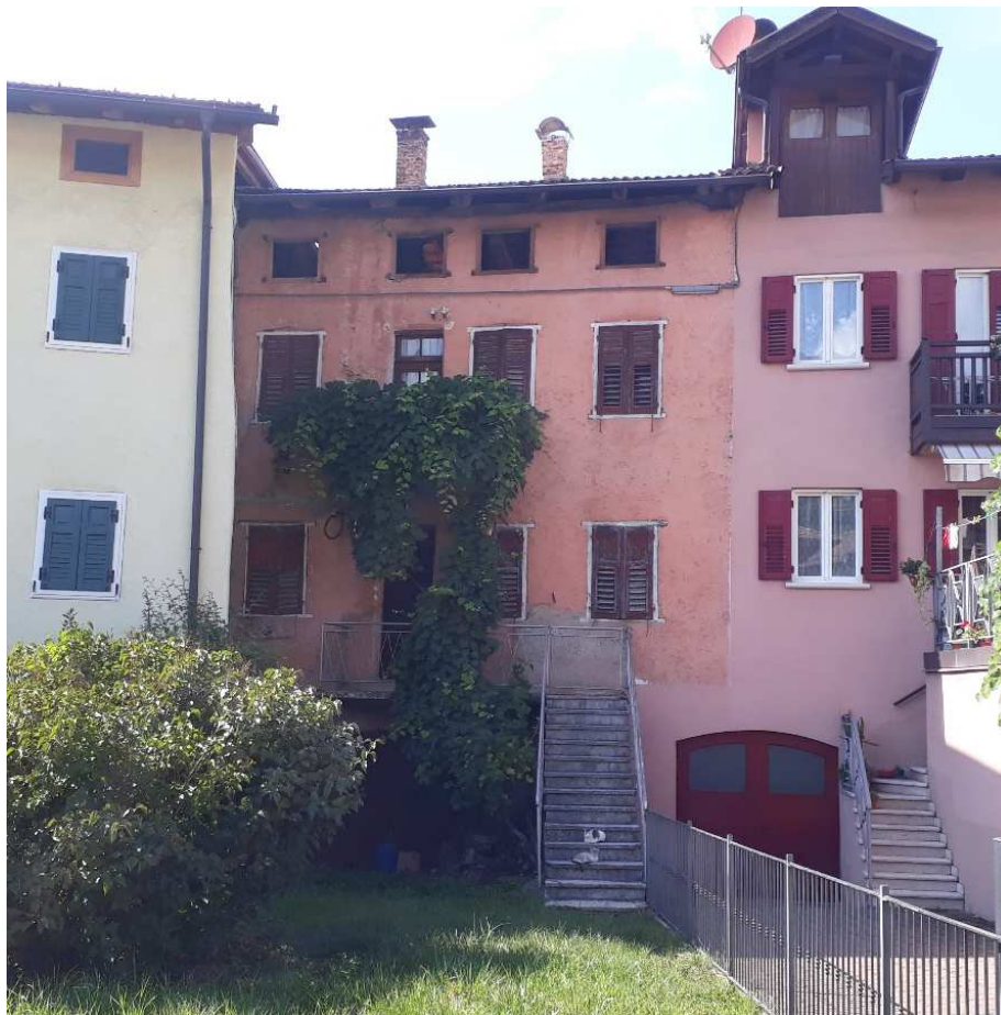
Vista da sud